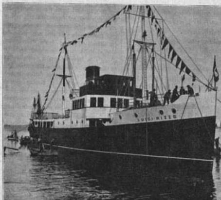
Il nuovo Piroscalo «Luigi Rizzo» della Società «Eolia» varato ad Ancona il 6.9.29 (V. cronaca in 3. pagina)